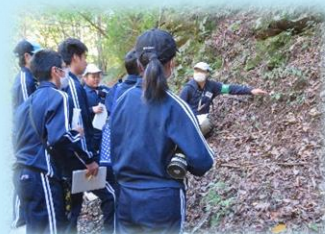
フォレストリースクール