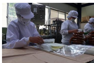
十石みそ工場 ラベル貼り