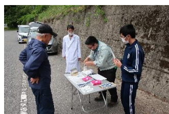
保健福祉課 狂犬病予防接種

この体験をとおして2年生が少し大人になったように感じます。ご協力くださった事業者の皆様、厚く御礼申し上げます。