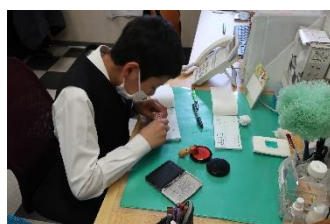
ウイルスせらぎ 事務手伝い