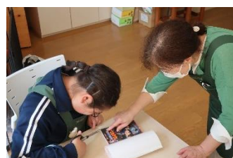
図書館 ブックカバー貼り